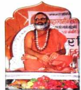
अनन्तशिवशुभ्रिण विद्वान्मन्त्र शारदापीठशुभ्रिण जगद्गुरु शङ्कराचार्य स्वामी श्री शारदा जीश्वर जी गद्दुराज