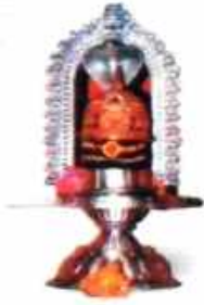
भगवान् श्री चन्द्रमौलीश्वर