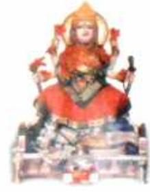
परमम्मा भगवती राजराजेश्वरी